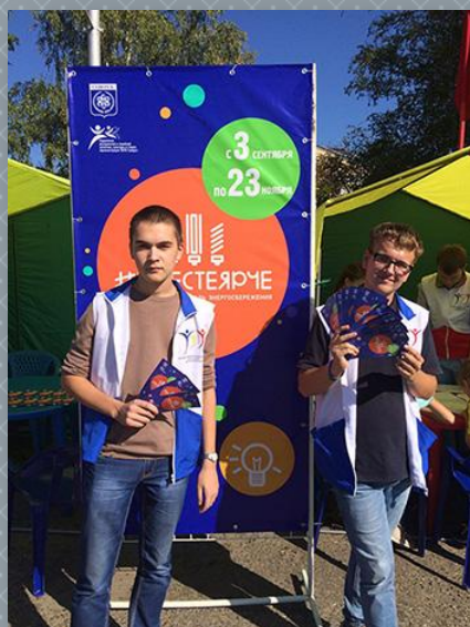
Организация агитационной площадки в п. Самусь, проводимой в рамках Всероссийского фестиваля энергосбережения «Вместе ярче»