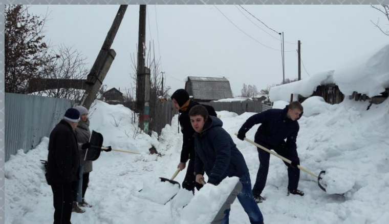
Акция «Снежный десант»