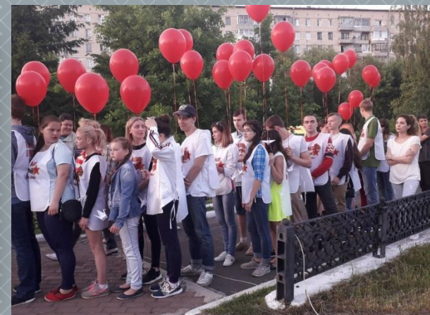
Акция «Свеча памяти»