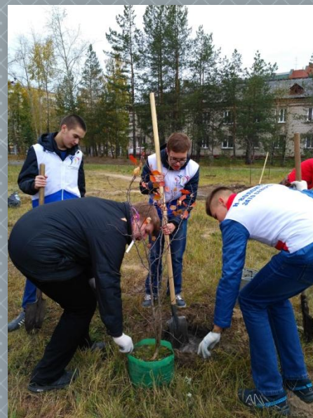
Акция «Посади свое дерево»