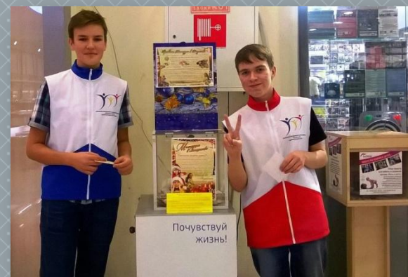
Милосердие в Рождество