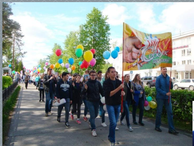
Городская акция «Северск не курит!»