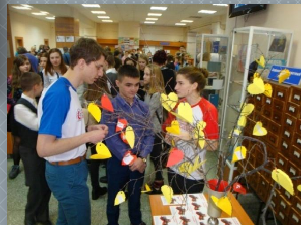
Городской фестиваль «Пусть всегда будет завтра»