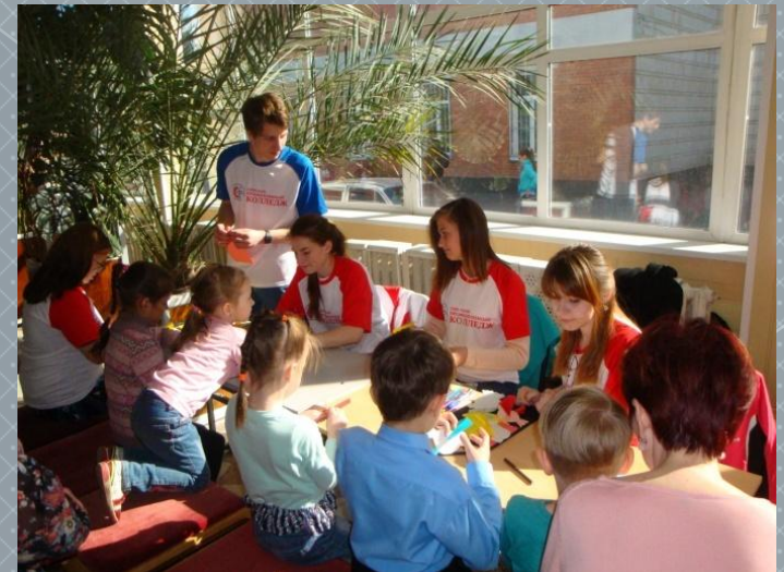
Городской праздник «День семьи»