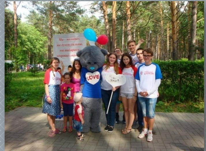
Городской фестиваль «Живи ярко»