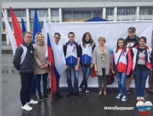
Акция «День России»