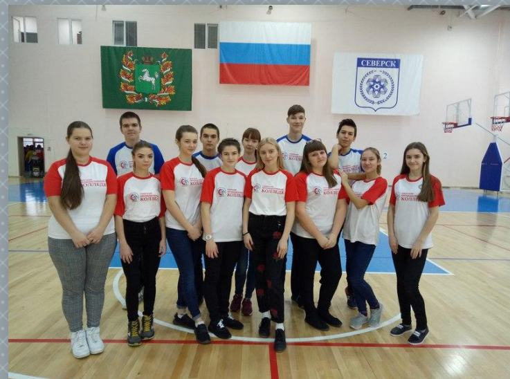
Участие в мероприятиях, приуроченных к декаде инвалидов