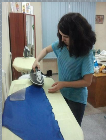
Подготовка к акции «Синий платочек»