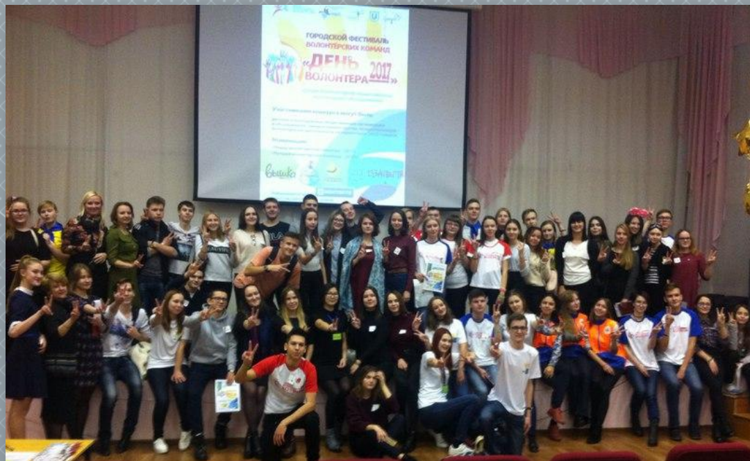
Городской Фестиваль волонтерских команд