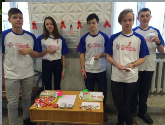
Акция 1 декабря «День борьбы со СПИДом»