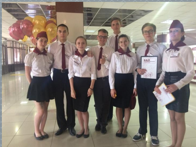
Бал краснодипломников в системе СПО