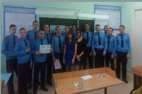
Профилактические беседы в кадетском корпусе