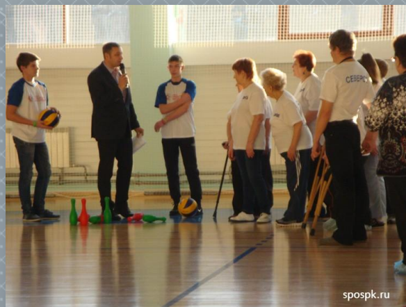
Спортивный праздник для людей с ОВЗ