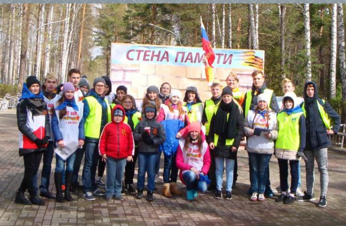
Акция «Стена памяти»