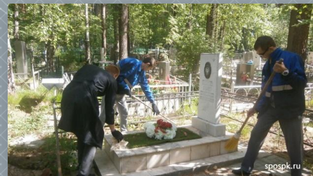
Шефство над могилами выпускников, погибших в «горячих точках»