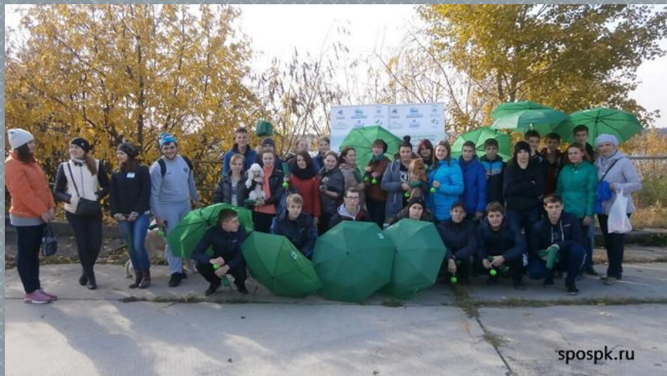
Акция «Чистый берег»