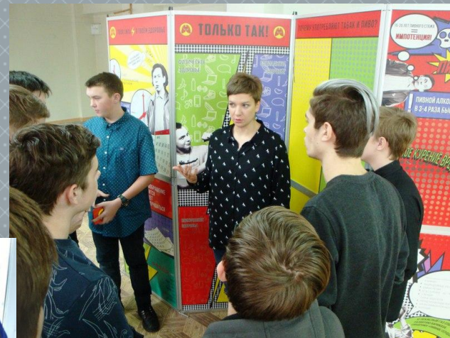
Интерактивная выставка «Только так»