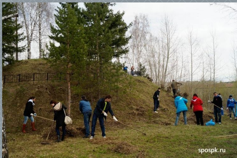
Акция «Зеленая весна»