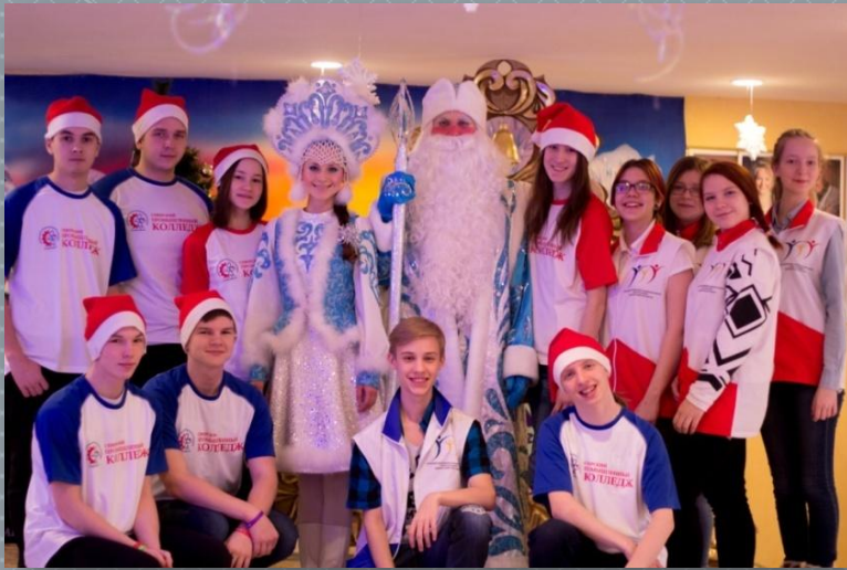
Праздник «Милосердие в Рождество»