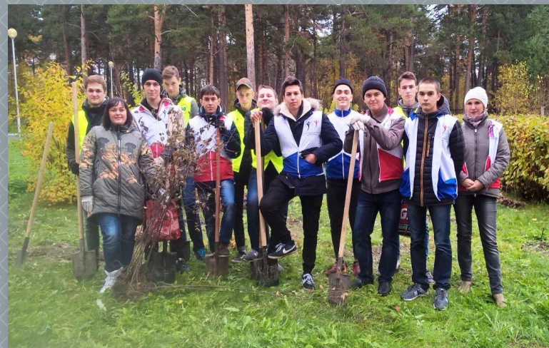
Акция «Аллея жизни»