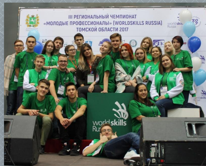
WorldSkills Russia Томск