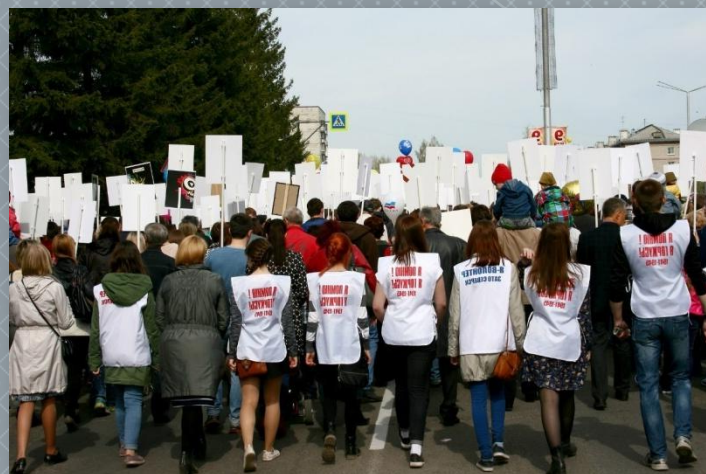
Акция «Бессмертный полк»